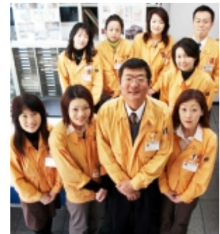
(株)Gハウス池田総合建設の皆さん